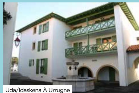
Uda/Idaskena À Urrugne