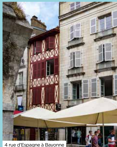
4 rue d'Espagne à Bayonne