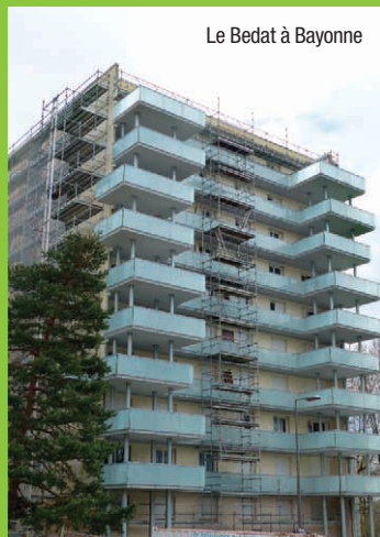
Le Bedat à Bayonne

Des travaux de ventilation avec création d'un système de VMC sont prévus pour cette année dans notre résidence de Mauléon. Une étude est en cours.